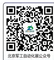
北京军工自动化展公众号